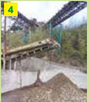
4 クラッシャーによって 更に小さく粉砕します