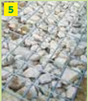
5 建物の基礎に敷く栗石や 砂利として再利用します