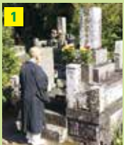
1 墓石に宿っている 仏様の魂を抜取ります