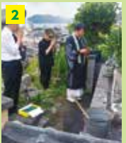
2 御先祖様へ 墓じまいの報告をします