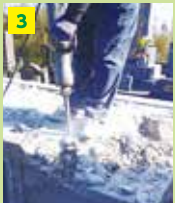
3 石塔を小さく割り 搬出します