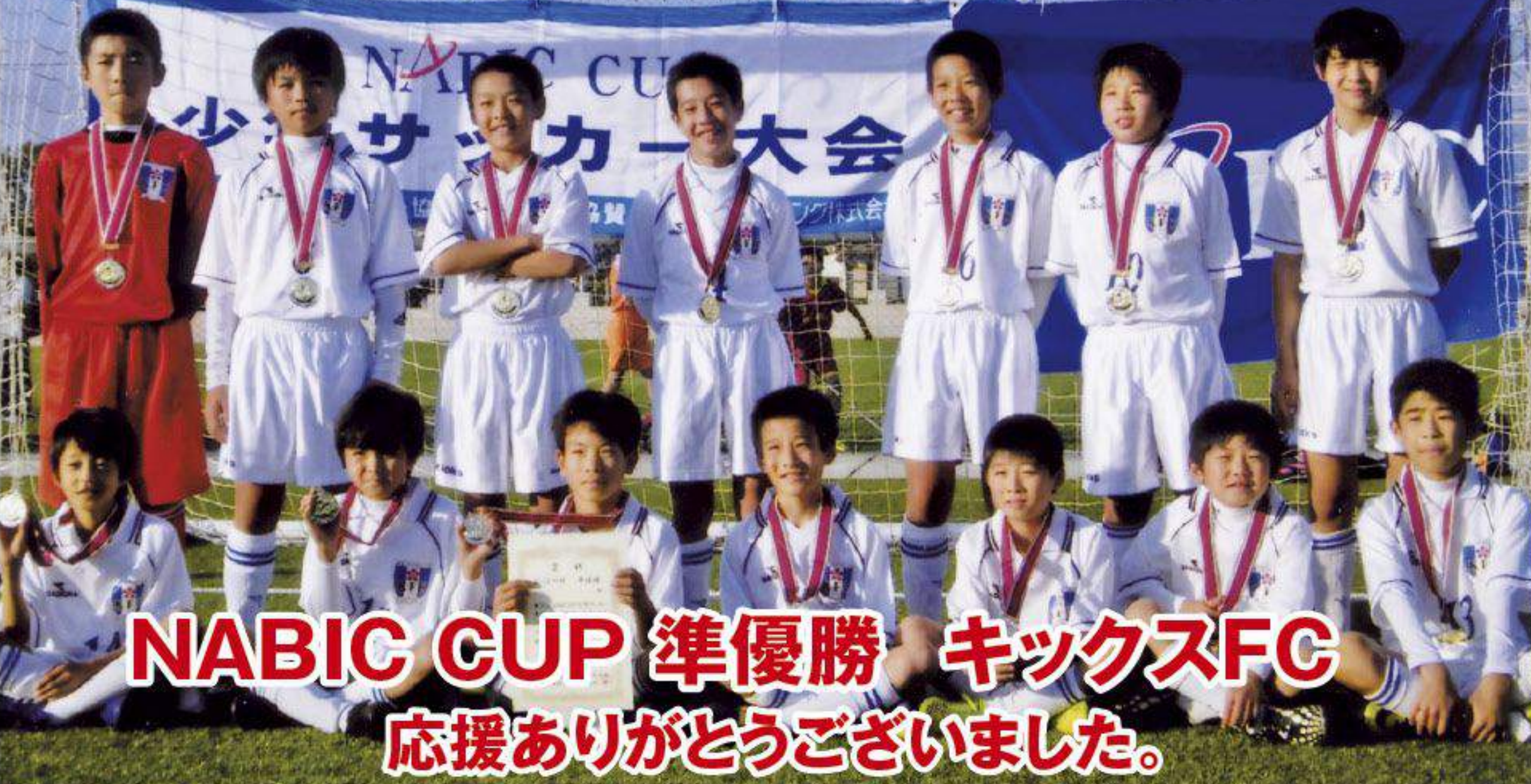
NABIC CUP 準優勝 キックスFC 応援ありがとうございました。