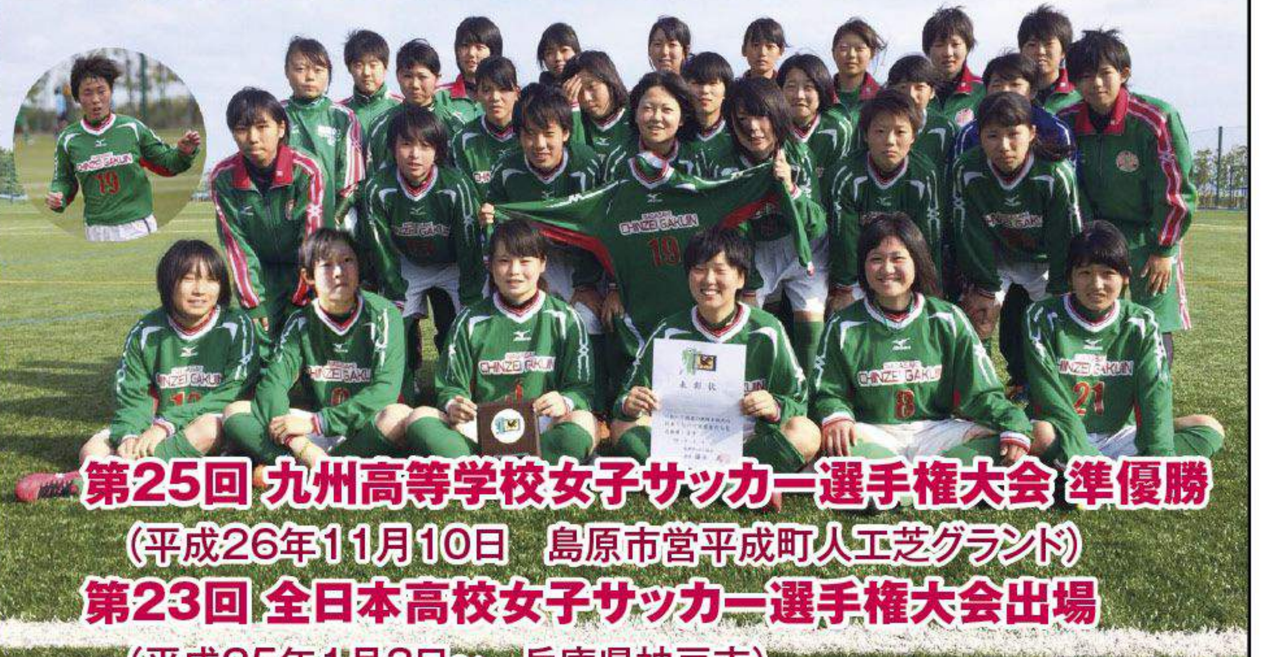
第25回 九州高等学校女子サッカー選手権大会 準優勝 (平成26年11月10日 島原市営平成町人工芝グラウンド) 第23回 全日本高校女子サッカー選手権大会出場 (平成25年1月3日～ 兵庫県神戸市)

マンボウ TEL 0957-52-7485 FAX 52-7148 〒856-0814 大村市松並1丁目180-3 発行 株式会社 つじ印刷 TEL 0957-52-3230 〒856-0033 大村市荒平町1472-1 マンボウホームページアドレス manbow-web.com/ Eメールアドレス manbow@tsuji-p.co.jp Eメールアドレス main@tsuji-p.co.jp