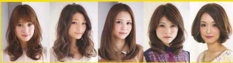
デジタルパーマ エアーウェーブ 縮毛矯正 縮毛矯正+デジタルパーマ

お客様の髪を大切にしたい。幅広い年齢層のお客様にお気軽に来て頂きたい。その思いから... 上質な薬剤「資生堂」製品を使用し、この低価格。 満足して頂けるヘアスタイル作りをしたい。そんな思いから... 施術後1週間以内はお直し無料の安心の保証期間制度