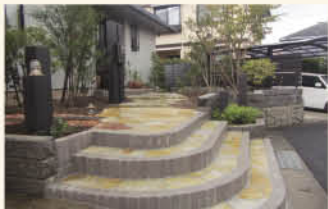
建物も大きく見えゆったりとした玄関に