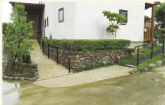
歩行手すりでも高齢者も安全な玄関