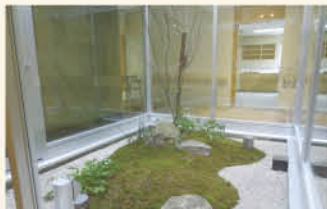
ほっとする中庭の緑、心もおだやかに