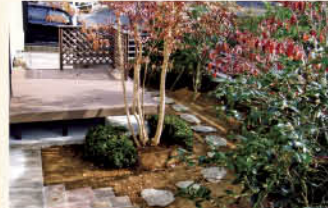
木漏日のウッドデッキ家族でティータイム