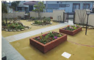
広すぎる庭も雑草アタックですっきり