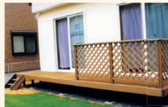
メンテナンスフリーの人工木材フェンス