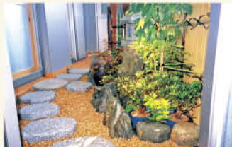
ベランダの庭窓を開けると涼しい緑