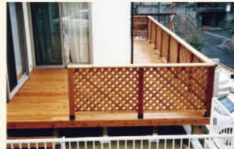
狭い敷地もウッドデッキで安全